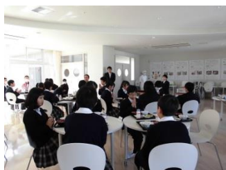
ランチルームの様子