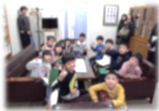
校長室に集まった児童のみなさん

後日、児童の皆さんから丁寧な手紙が届けられ、中野中の校舎が立派なこと、プールが綺麗なこと、図書室の本が11500冊あること、体育館が広くて大きいこと、給食がおいしそうなこと、そして、中学生になったら中野中に絶対入りたいなどの感想や決意が書かれていました。