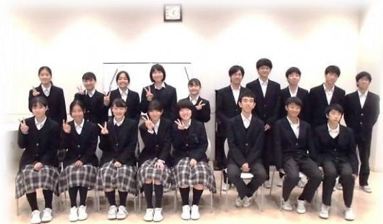
地区懇談会に参加した18名