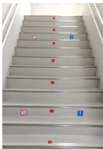
階段も右側通行です