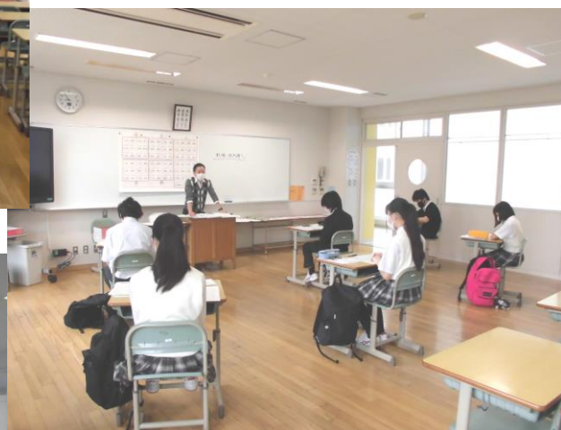
2年C組のグループ連絡の様子