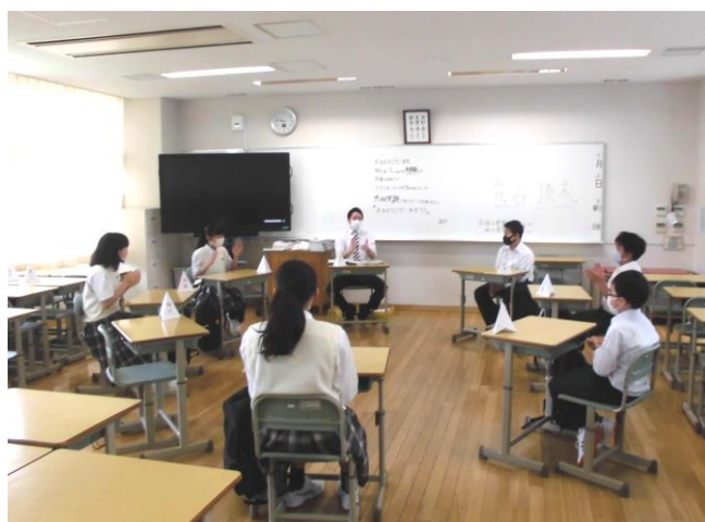
1年C組のグループ連絡の様子

5月26日、学校再開に向けて前回の「個別連絡」に続き「グループ連絡」を行いました。生徒にとってはわずか30分程度の登校でしたが、久しぶりに担任やクラスメートに会い、とても満ち足りた表情で学校を後にしていました。