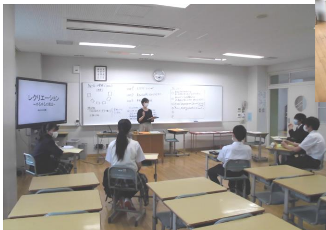
3年B組のグループ連絡の様子