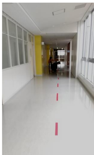
廊下は右側通行です