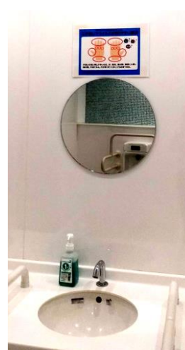
手洗いは丁寧に・・・