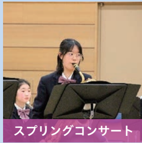
スプリングコンサート