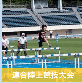
連合陸上競技大会