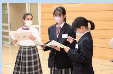
1年生 自己紹介の様子