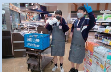
2年生 職場体験の様子