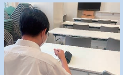
自習室で学習に励む様子