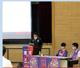
F C 東京講演会