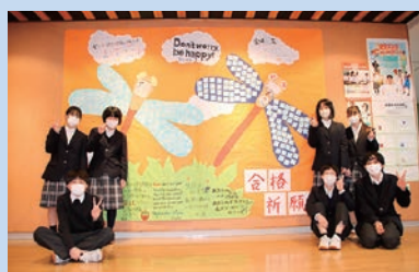
生徒会 合格祈願作成