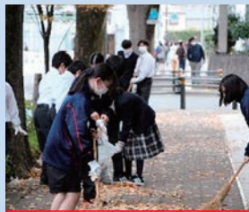
落ち葉はきボランティア