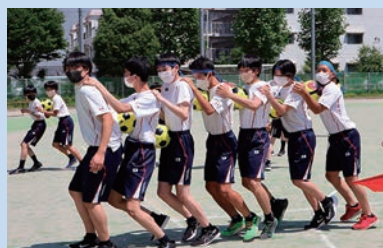
3年生 運動会オリジナル競技