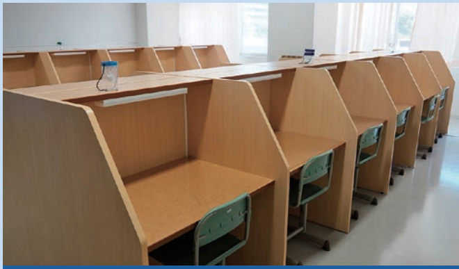
1人1ブースの自習室