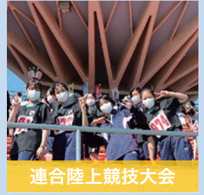
連合陸上競技大会