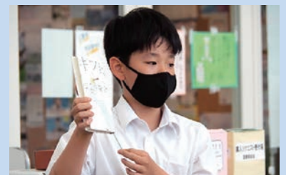
ビブリオバトルの様子