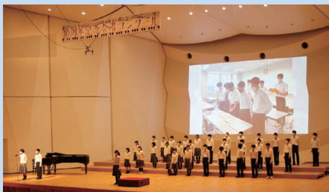
10周年記念合唱コンクール